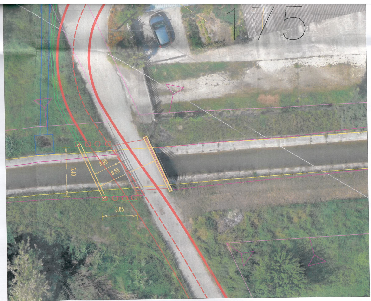
INTERVENTO PONTE B