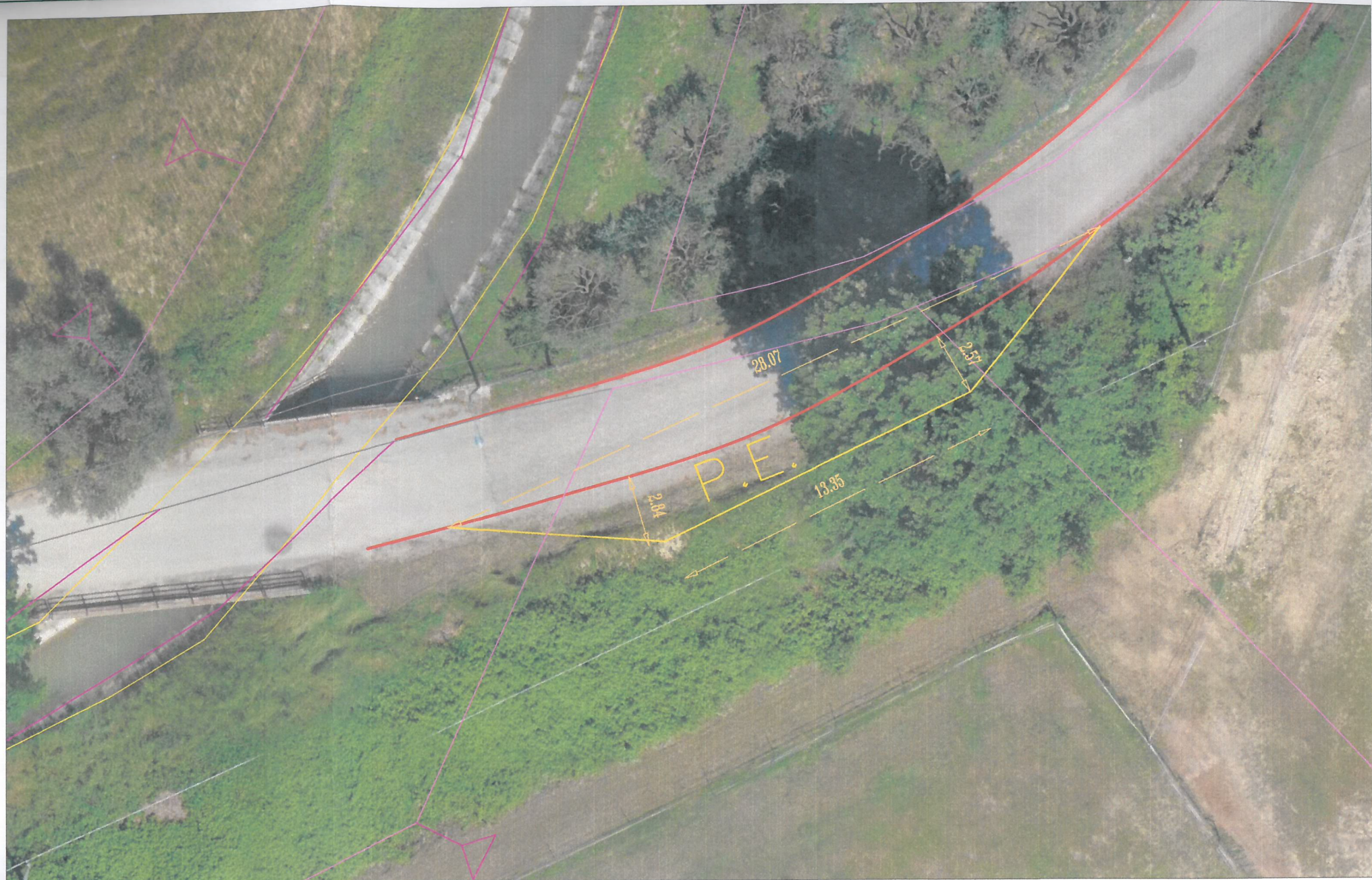
INTERVENTO PIAZZOLA DI EMERGENZA N 1