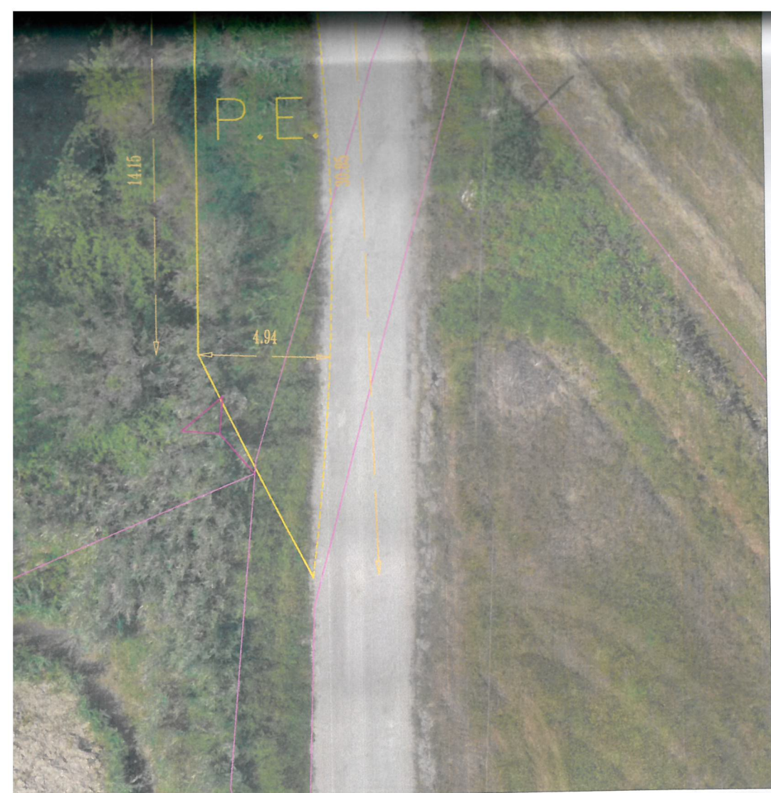
INTERVENTO PIAZZOLA DI EMERGENZA N 3