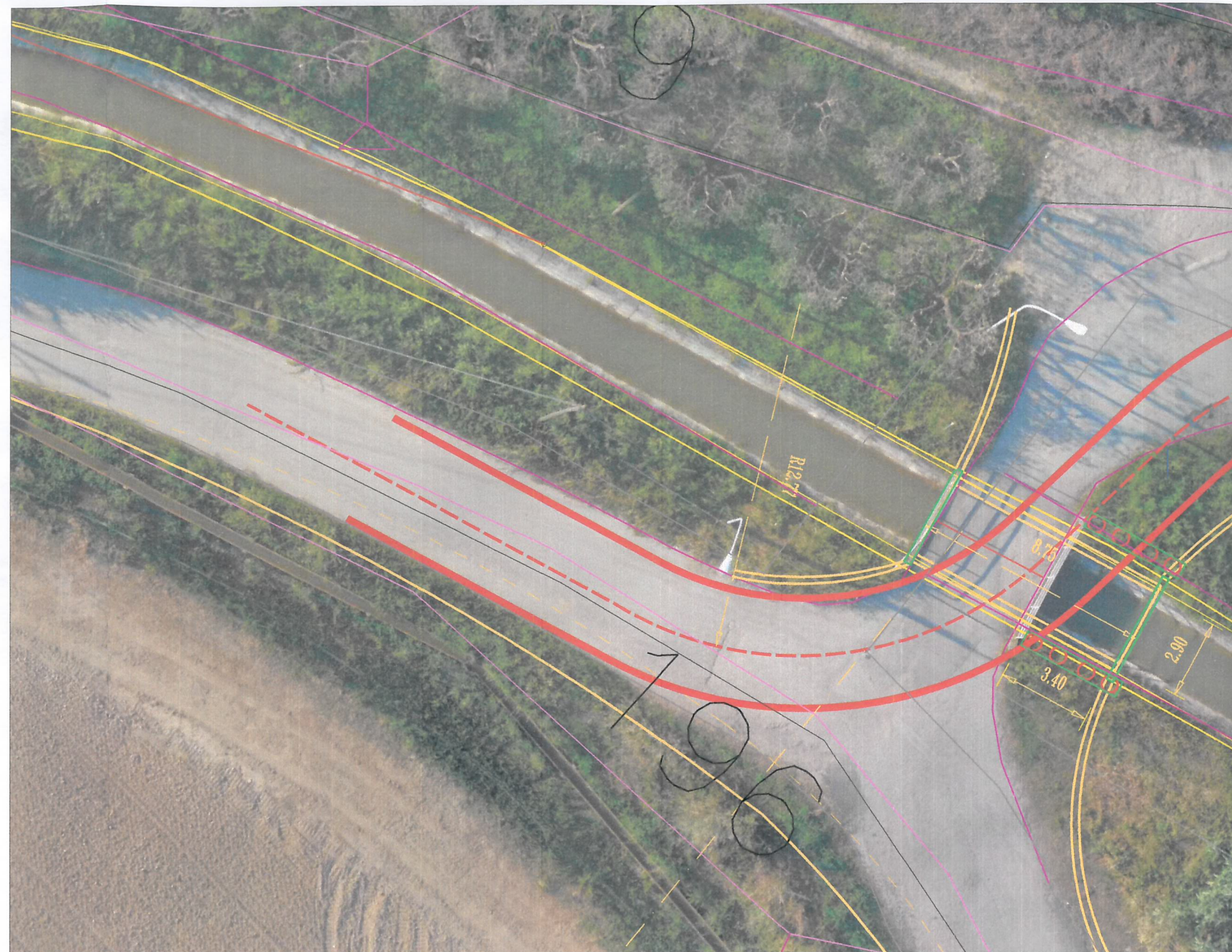
INTERVENTO PONTE A