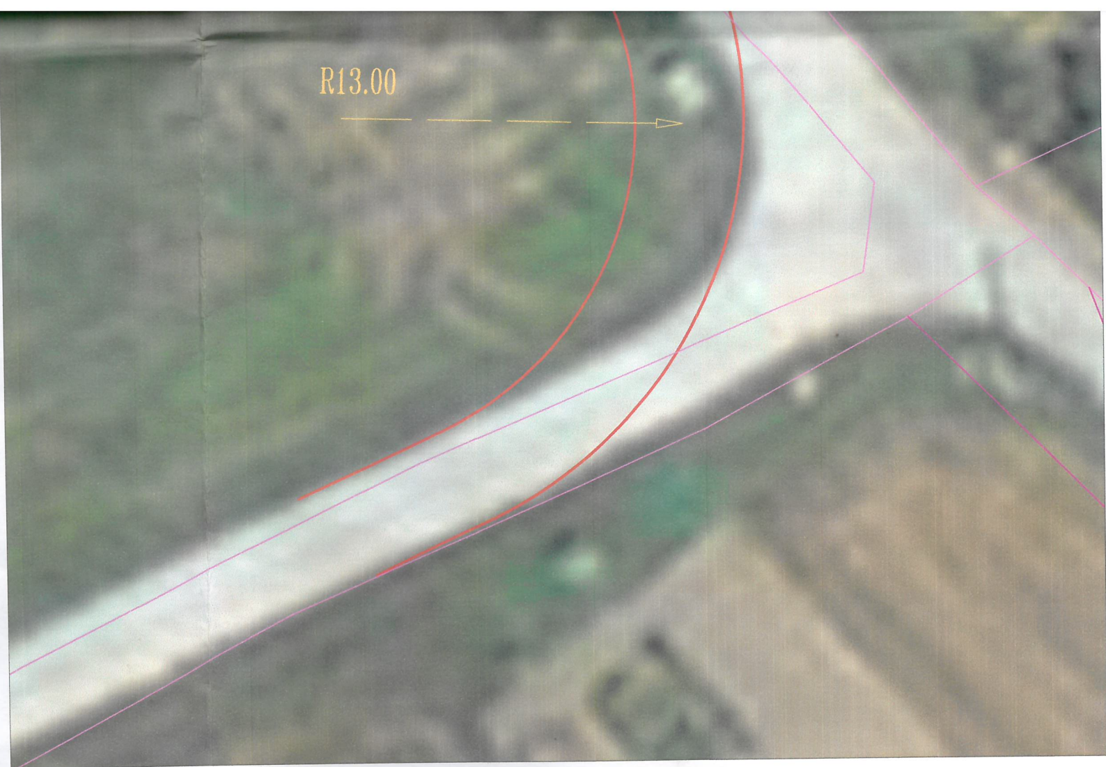
INTERVENTO ADEGUAMENTO CURVA