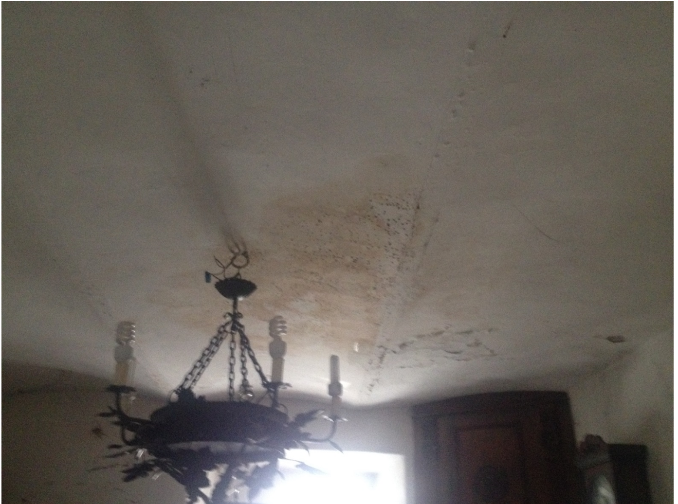
soffitto in volta

Via Racchini 18 - 02100 - Rieti Cell. 339-7903894 e-mail: andrea.cecilia@ymail.com P. I.V.A 00937660579 C.F. CCL NDR 70L24 H282B