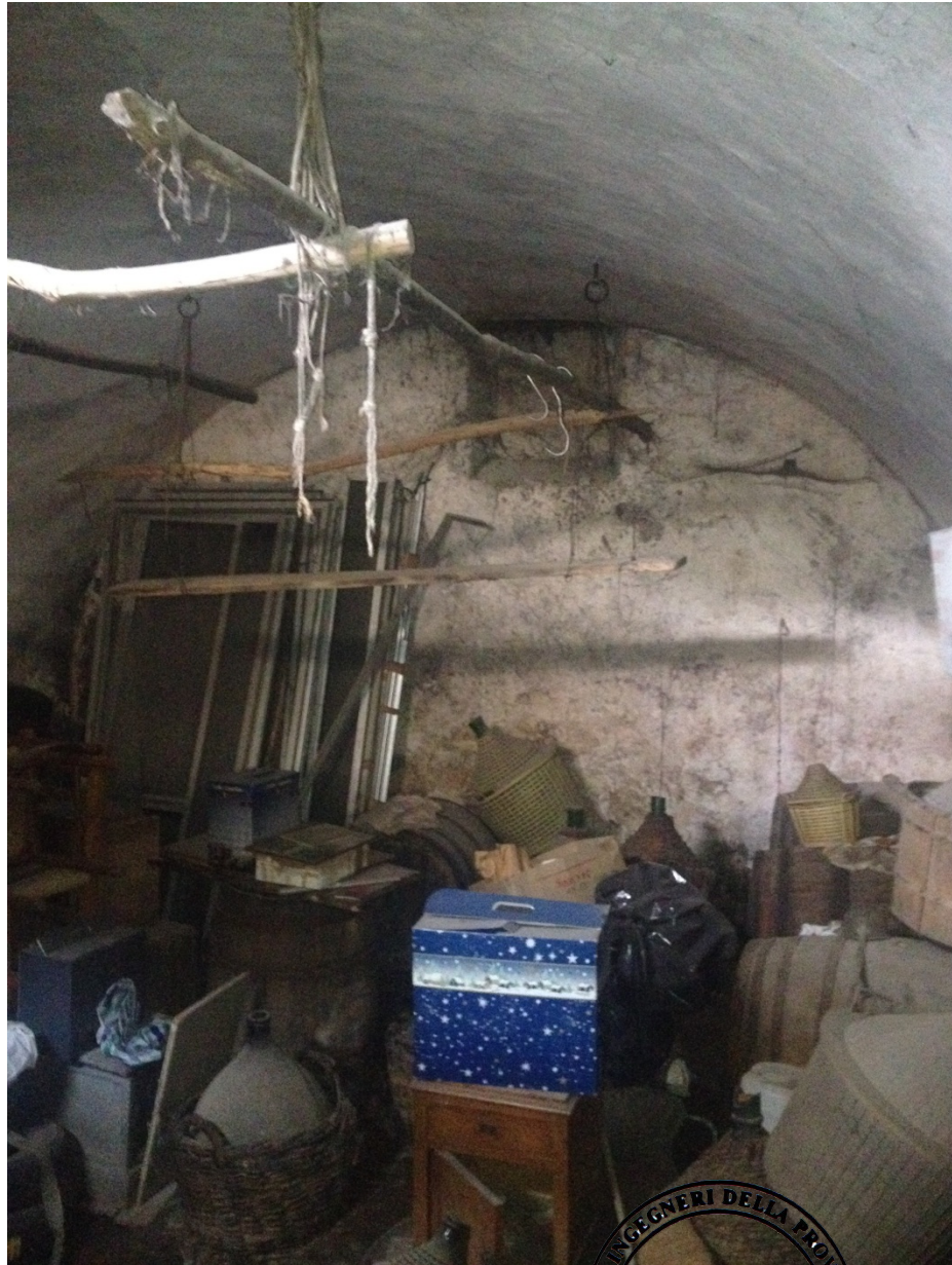
Volta piano terra

Via Raccuini 18 - 02100 - Rieti Cell. 339-7903894 e-mail: andrea.cecilia@ymail.com P. I.V.A 00937660579 C.F. CCL NDR 70L24 H282B