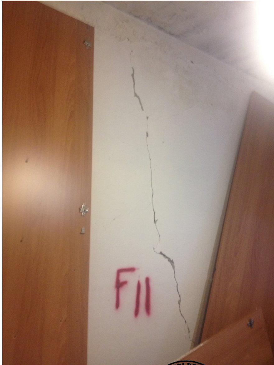
Lesioni sulle pareti

Via Racchini 18 - 02100 - Rieti Cell. 339-7903894 e-mail: andrea.cecilia@ymail.com P. I.V.A 00937660579 C.F. CCL NDR 70L24 H282B