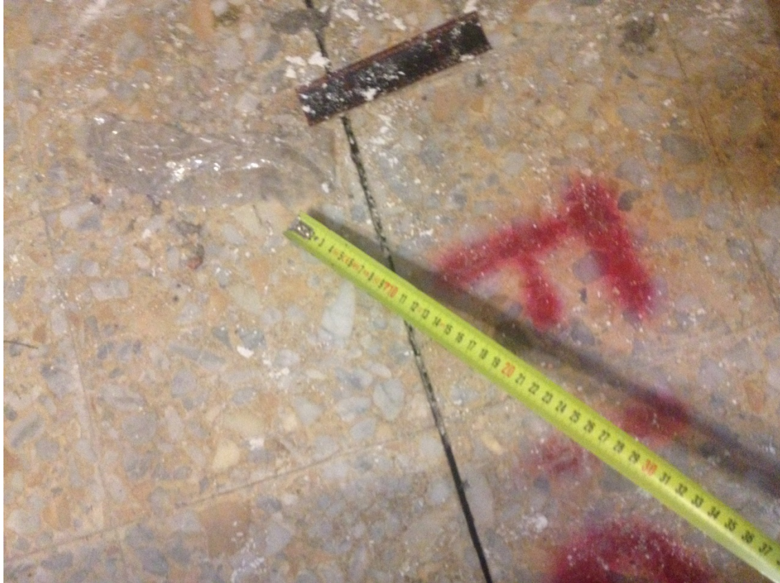
Lesioni sul pavimento del secondo solaio

Via Racchini 18 - 02100 - Rieti Cell. 339-7903894 e-mail: andrea.cecilia@ymail.com P. I.V.A 00937660579 C.F. CCL NDR 70L24 H282B