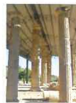
Scavi Archeologici "CUMM"

e-mail: com.monterinaldo@provincia.fm.it pec: comune.monterinaldo@emarche.it