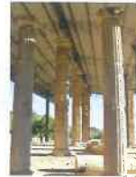
Scavi Archeologici "CIL.MA"

e-mail: com.monterinaldo@provincia.fm.it pec: comune.monterinaldo@emarche.it