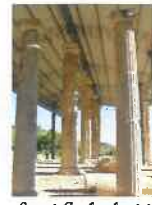
Scavi Archeologici "CULMA"

e-mail: com.monterinaldo@provincia.fm.it pec: comune.monterinaldo@emarche.it