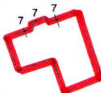
PIANTA PIANO SEMINTERRATO