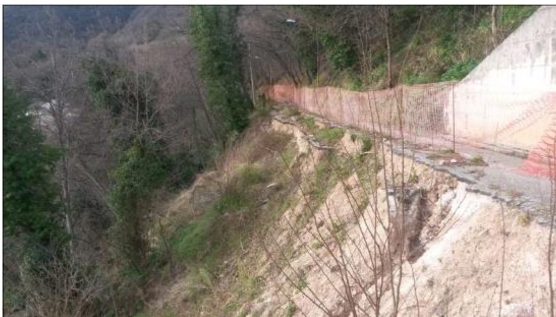
Tratto di strada collegamento Croce - Castiglione di Croce