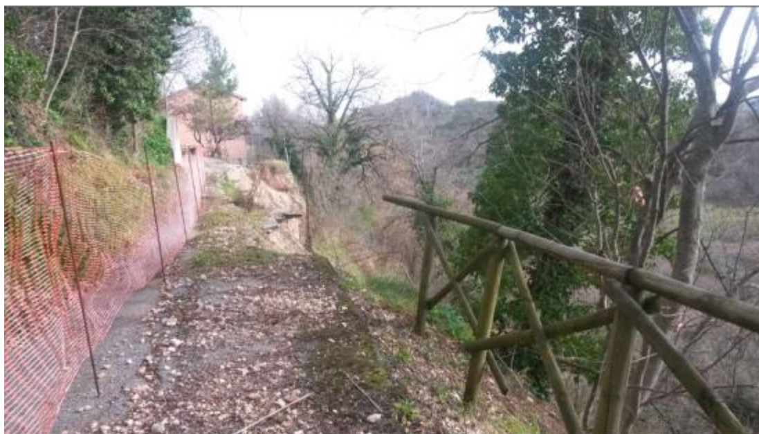
Tratto di strada collegamento Croce - Castiglione di Croce