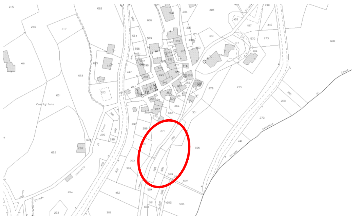
Estratto catastale tratto di strada collegamento Croce - Castiglione di Croce