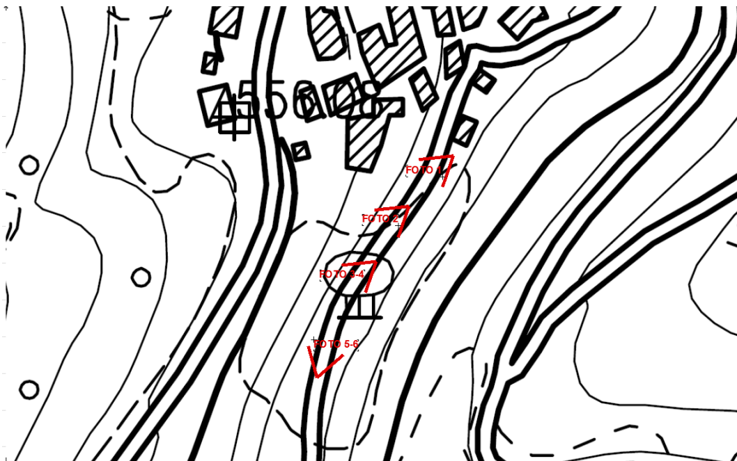
PUNTI DI VISTA FOTOGRAFICI